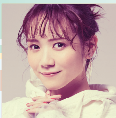
田村 真佑 (乃木坂46)