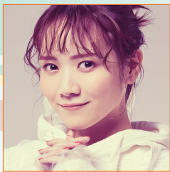
田村 真佑 (乃木坂46)