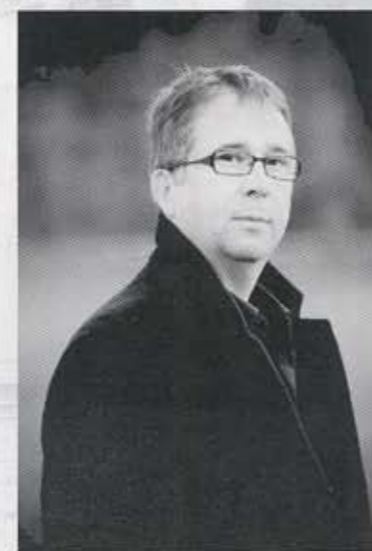
ベルトラン・ドゥ・ビリー Bertrand de Billy

パリ生まれ。ドイツのデッサウ・アンハルト劇場、ウィーン・フォルクスオーパーの指揮者を務めた後、ベルリン国立歌劇場、ハンブルク国立歌劇場、バイエルン国立歌劇場、ウィーン国立歌劇場、コヴェント・ガーデン王立歌劇場、モネ劇場、パリ・オペラ座、メトロポリタン歌劇場等に出演。1999年から2004年までバルセロナ・リセウ大劇場の音楽監督を務める。