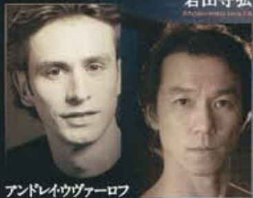
アンドレイウヴァーロフ