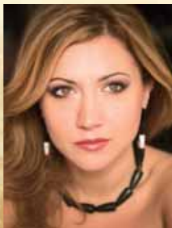
世界一流歌劇場を席巻する 美貌のコロラトゥーラ。 満を持してのヴィオレッタ。日本初披露！ デジレ・ランカトーレ

「乾杯の歌」 「ああ、そはかの人か」 「花から花へ」 「プロヴァンスの海と陸」… 名アリアの数々！