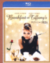
ティファニーで朝食を

発売元: バンダイナムコエンターテインメント 価格: Blu-ray 2,381円+税 見附中