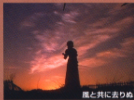
風と共に去りぬ