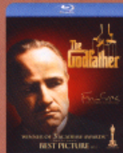
ゴッドファーザーPART I ＜デジタル・リストア版＞