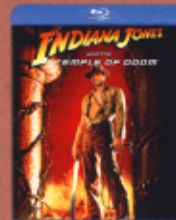
インディ・ジョーンズ 魔窟の伝説