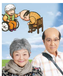
© Presentation licensed by Disney Concerts © Disney

11/18日 日・19日 月 11/18(日) 11:00、15:30 11/19(月) 13:00