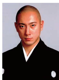
© Presentation licensed by Disney Concerts © Disney