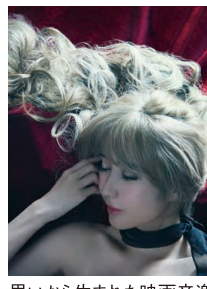
© Presentation licensed by Disney Concerts © Disney