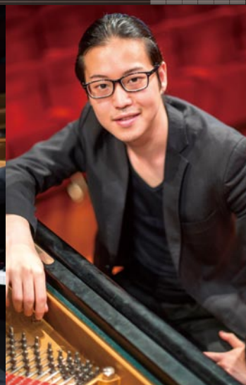
© Ariga Terasawa 衣裳企画: (株) オンワード 櫻山 縫製: グッドヒル (株)