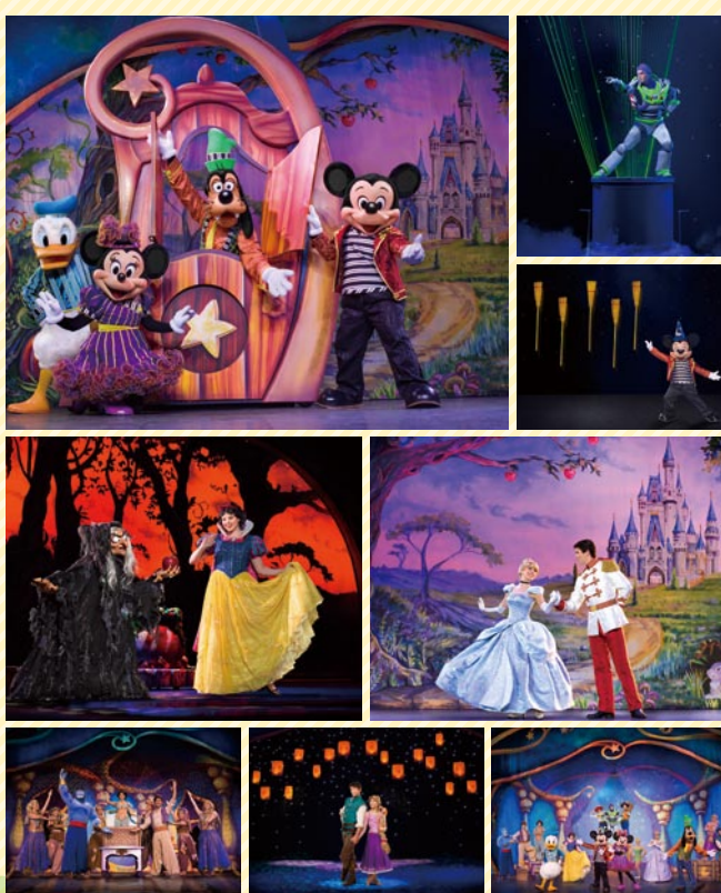
Disney characters and artwork ©Disney, Disney/Pixar characters ©Disney/Pixar