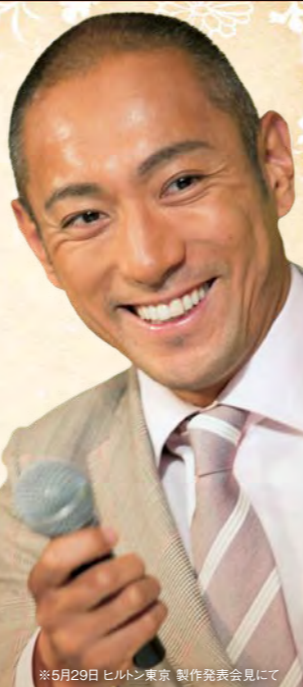
※5月29日 ヒルトン東京 製作発表会見にて