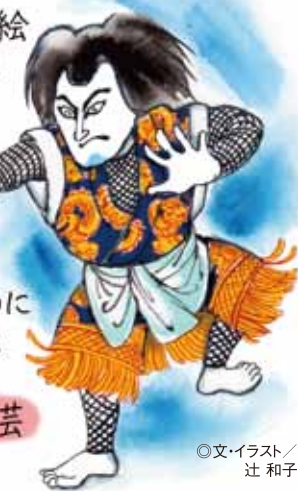
◎文・イラスト/ 辻 和子