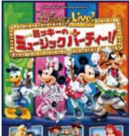
ディズニー・ライブ! 中京テレビ事務局(平日9:30～17:30) TEL052-961-3330

ミッキーたちと一緒に歌って、踊って、遊べる、ディズニー・ライブ! 「ミッキーのミュージックパーティー!!」にみんなおいでよ!! 名古屋公演 愛知県芸術劇場大ホール 3/24(土)～3/27(火) 3/24(土) 14:30/17:30 3/25(日) 26(月) 27(火) 10:30/13:30/16:30 豊田公演 豊田市民文化会館 8/18(土) 8/19(日) 10:00/13:00/16:00 S席¥5,000 A席¥3,800 チケット発売中 ※2歳以下のお子様は、保護者1名につき1名までヒザ上無料。ただし、お席が必要な方は有料。